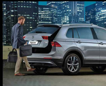
باز شدن درب صندوق عقب به صورت هوشمند