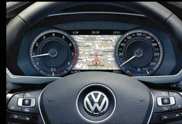
صفحه کیلومتر دیجیتال پیشرفته