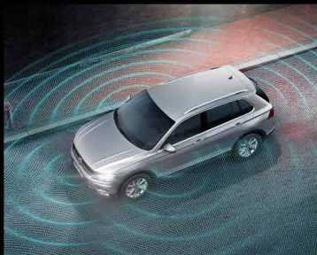
دوربین ۳۶۰ درجه