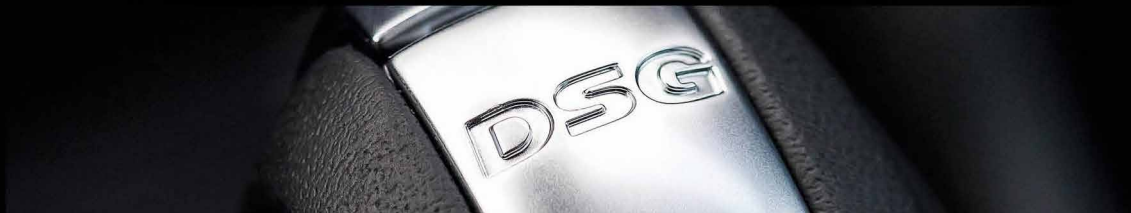
گیربکس اتوماتیک (DSG)