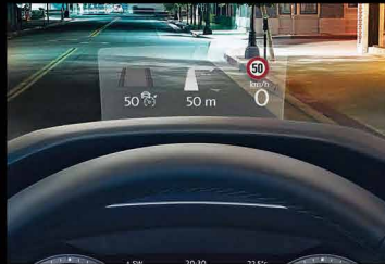
Head up display