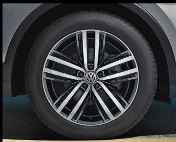
رینگ ۱۹ اینچی آلومینیومی