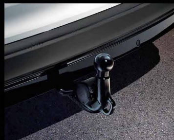
Trailer Hitch با قابلیت تا شوندگی به صورت الکتریکی